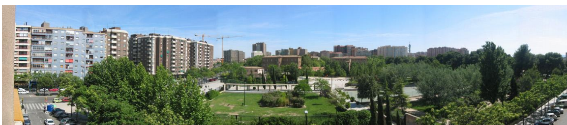
Vía Universitas y Parque Delicias (2005)

La cesión de estos terrenos propicio el desdoblamiento de Vía Universitas y Duquesa Villahermosa , así como la creación de un nuevo parque para el barrio ( inaugurado el 25 de febrero de 1995 ). Posteriormente se han ido acondicionando los pabellones, que gracias a la lucha reivindicativa de entidades sociales, han sido recuperados para fines sociales y culturales.