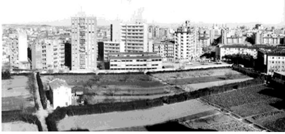
Las huertas del Psiquiátrico años 70

El nuevo emplazamiento estaba situado en unas fincas situadas en