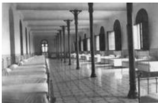
Hospital Psiquiátrico Ntra. Sra. de Gracia principios de siglo XX