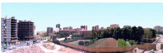
Las huertas del Psiquiátrico (años 80)

El Plan General de Ordenación Urbana de Zaragoza (Plan Larrode 1968) , redujo las áreas de zonas verdes, que se preveían en el Plan Yarza de 1956 y propició el “boom urbanístico” en nuestra ciudad. El Polígono 22, al cambiar la ordenación urbana de la ciudad, el hospital fue considerado como zona verde del barrio (aunque los vecinos no podían disfrutarlo, debido a la existencia de las tapias de adobe).